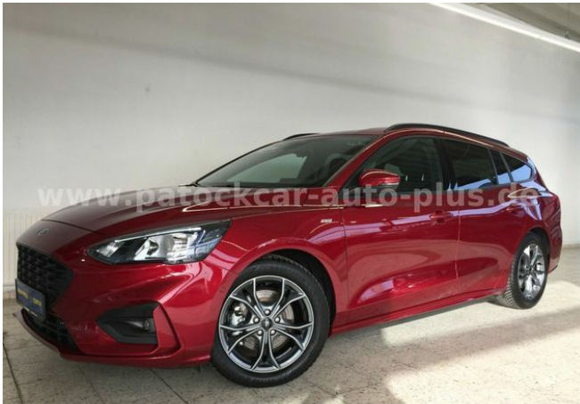
Mehrmarken-Center & ad Auto Dienst