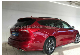
Mehrmarken-Center & ad Auto Dienst