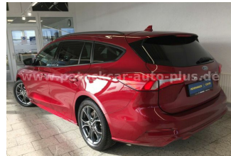
Mehrmarken-Center & ad Auto Dienst