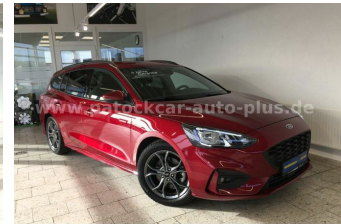
Mehrmarken-Center & ad Auto Dienst