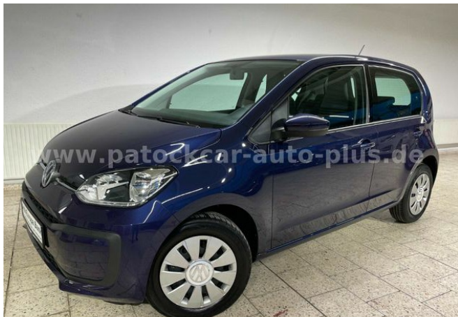
Mehrmarken-Center & ad Auto Dienst