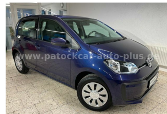
Mehrmarken-Center & ad Auto Dienst