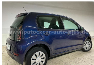
Mehrmarken-Center & ad Auto Dienst