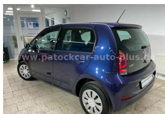
Mehrmarken-Center & ad Auto Dienst