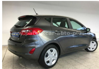
Mehrmarken-Center & ad Auto Dienst