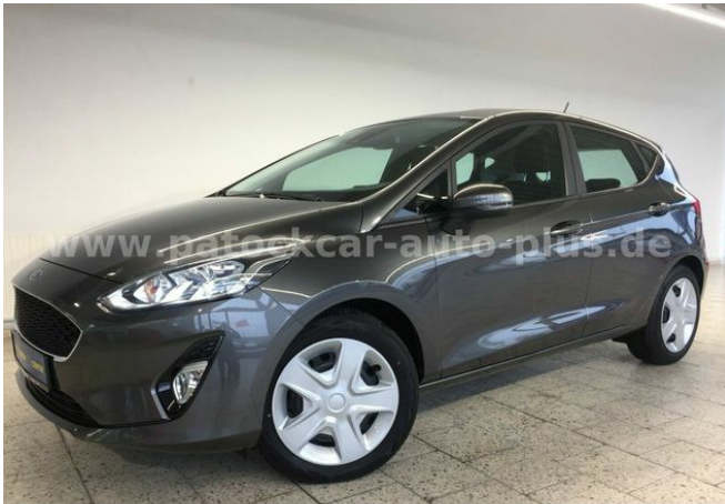
Mehrmarken-Center & ad Auto Dienst