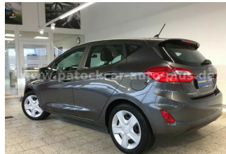
Mehrmarken-Center & ad Auto Dienst