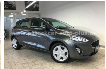
Mehrmarken-Center & ad Auto Dienst