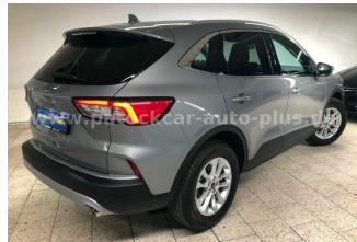
Mehrmarken-Center & ad Auto Dienst