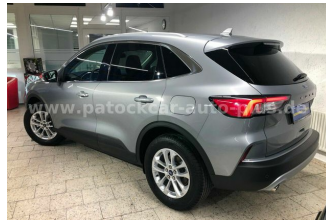
Mehrmarken-Center & ad Auto Dienst