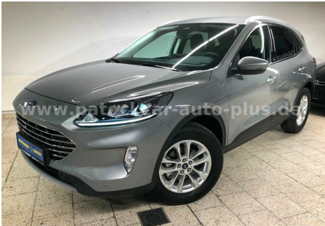
Mehrmarken-Center & ad Auto Dienst