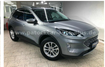
Mehrmarken-Center & ad Auto Dienst